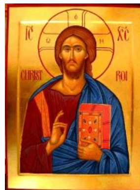
LUMIERE DES HOMMES

3. Rassemble tous nos frères À l'ombre de tes grands bras. Par toi, Dieu notre Père Au Ciel nous accueillera.