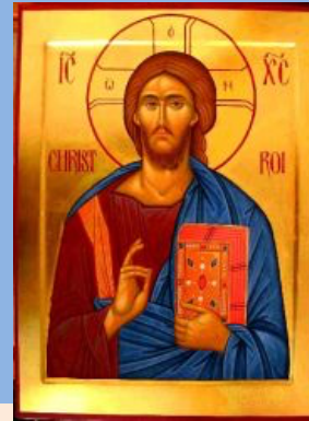
LUMIERE DES HOMMES

3. Rassemble tous nos frères À l'ombre de tes grands bras. Par toi, Dieu notre Père Au Ciel nous accueillera.